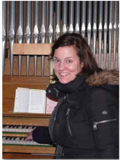
Kanzeltausch: Pfarrer Balde- weg auch Wolzach zu Gast in unserer Erlöserkirche