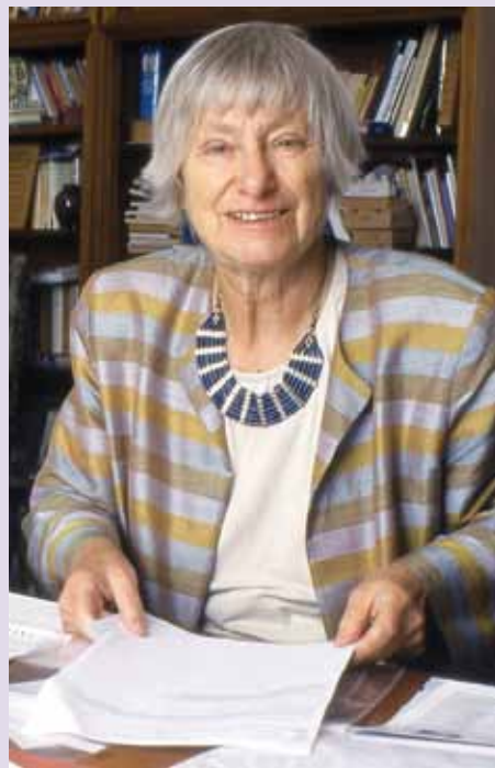
Dorothee Sölle, evang. Theologin und Dichterin