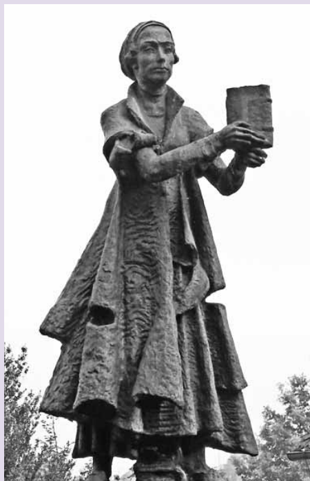
Argula von Grumbach, protestantische Publizistin und Reformatorin.