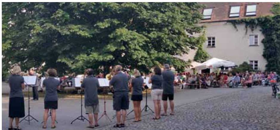
Archivbild MAI Blech-Andacht 2018